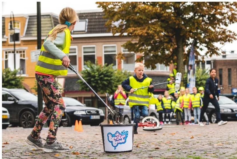
De BeestenBende zorgt voor een schoner Bergen, help jij ook mee?!

De BeestenBende is net van start gegaan in de gemeente Bergen en de eerste aanmeldingen zijn al binnen, maar natuurlijk is er ook nog plek voor jouw team! Je bent natuurlijk al heel druk met allerlei andere dingen, maar het kost je slechts een uurtje in de maand en je hoeft er niets voor te betalen. Kijk snel op www.mijnbeestenbende.nl als je meer wilt weten en om je aan te melden. Tot snel!